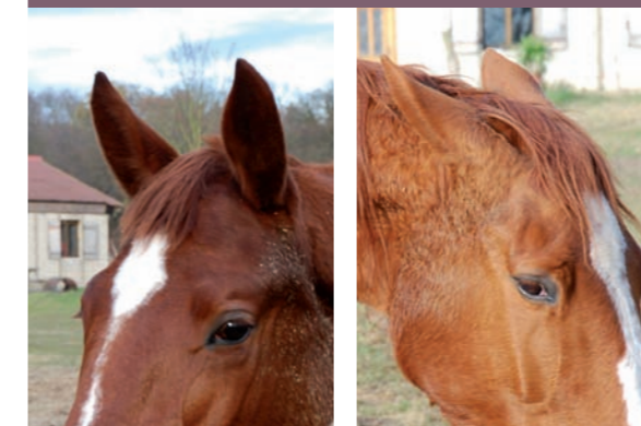
► Différentes attitudes

► La plage des fréquences entendue par les chevaux est de 6 à 33 500 Hz tandis que la plage humaine est de 35 à 20 000 Hz. L'oreille du cheval est aussi un moyen d'expression (curiosité, attention, peur...).