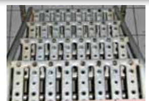
Revêtement antidérapant à grille