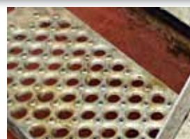
Revêtement antidérapant à trous

Les revêtements métalliques à grilles ou à trous sont de loin les plus sécurisants.