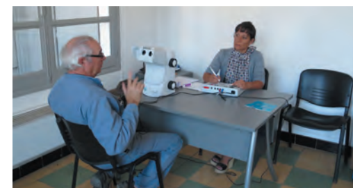
Examen médical d'aptitude