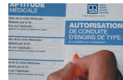
Formalisation par l'employeur

L'évaluation de l'expérience des opérateurs déterminera le temps de familiarisation nécessaire avec la machine (marque et modèle utilisé). Un opérateur de PEMP doit être formé et compétent. S'assurer qu'une personne au sol maîtrise la connaissance des commandes au sol et des commandes d'urgence : localisation et utilisation.