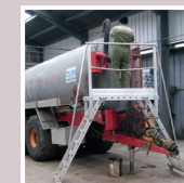
Plateforme Individuelle Roulante (PIR)