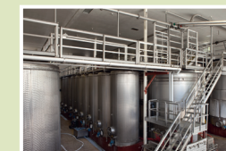
Passerelle avec garde-corps, accès escalier avec rambarde