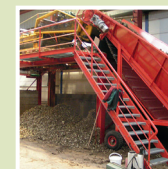
Déterreur avec escalier et rambarde